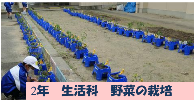
2年 生活科 野菜の栽培