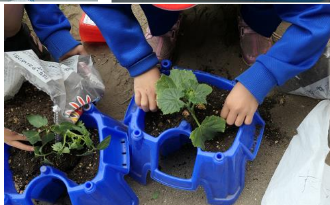
野菜の栽培と観察の実践