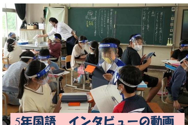
5年国語 インタビューの動画