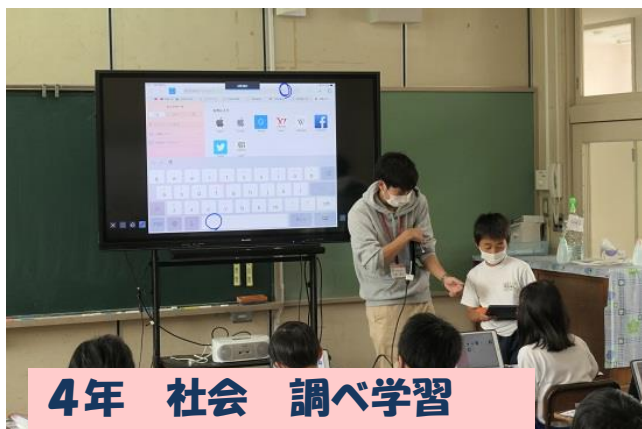
4年 社会 調べ学習

まだ、一部の児童でwi-fiに接続できない不備がありますが、教育委員会に連絡を取りながら徐々に改善させていきます。また、教員も使い方は様々ですが、お互いに紹介しあいながらスキルアップをしていきます。これからの授業が変わっていきます。