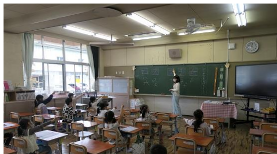
分散登校 1年 カタカナの学習