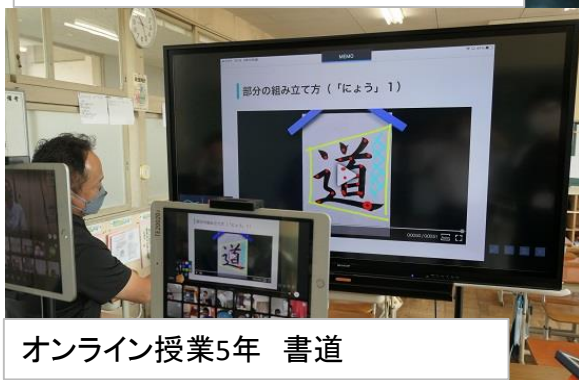
オンライン授業5年 書道