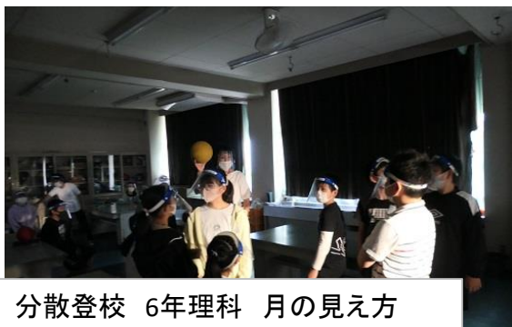
分散登校 6年理科 月の見え方