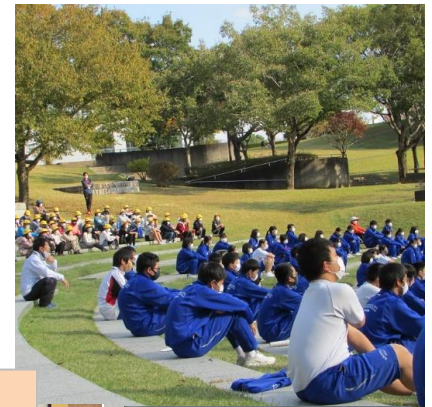
芸術の森公園 野外ホール