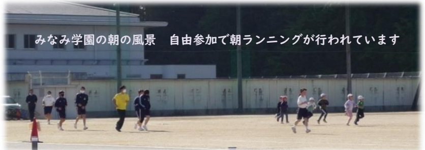
みなみ学園の朝の風景 自由参加で朝ランニングが行われています