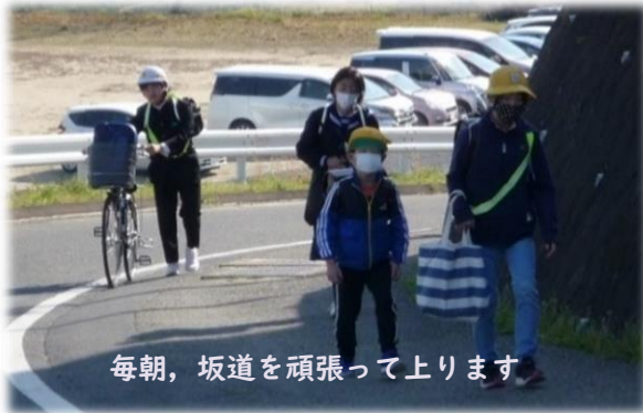
毎朝、坂道を頑張って上ります

今後は、「自分の考えを発信する（伝える）力」と「自己肯定感（自分の存在や価値を肯定すること）や自己有用感（人の役に立っていると思えること）」を高めていくことを意識しながら、創意工夫を生かした特色ある教育活動を行っていきます。取組の様子については、積極的に情報を発信してまいります。