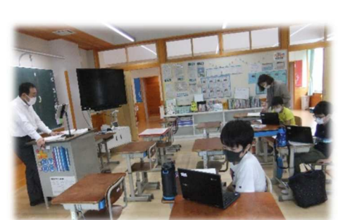
どのクラスにも二人以上の先生がいて オンライン授業をサポートしています