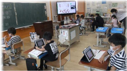
1年生も上手に勉強を進めています 「すららドリル」は楽しい！

9月2日(木)から始まった新しい形の学習(後期課程は期末テストがあったため、9月6日から)が、順調に進んでいます。児童クラブの子どもたちなどは、学校に登校して対面授業を受け、後期課程など多くの子どもたちが、自宅でオンライン授業に取り組んでいます。「この学習も楽しい」、「学校にいるみたいによく分かる」など、子どもたちからは前向きな意見も多く、コロナという有事にも、学びを止めずにいられることに、ほっとしています。