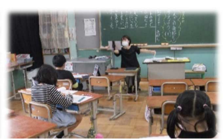
オンライン授業にも慣れてきて、画面 の切り替えなどももうまくなりました