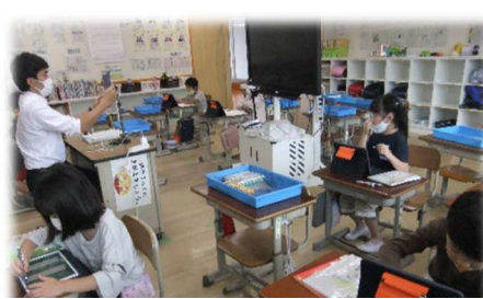
分からないことも、すぐに質問して 画面上で教えてもらえます