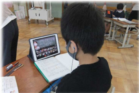
画面上に友達の顔が見えるので 明るい気持ちでがんばれます