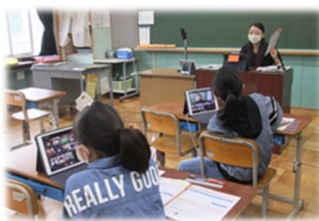
みんなと一緒に勉強できる日が 待ち遠しいです