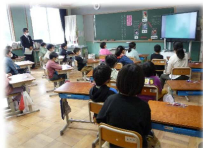
いじめは絶対にダメ

人権擁護委員の皆様4名をお迎えして、3年生と4年生で「人権教室」に取り組みました。「いじめ」という行為を例に、登場人物それぞれの気持ちを通して、他人への思いやりやいたわりの心といった人権尊重意識を養うことがねらいです。子どもたちは、ビデオの視聴を通して、「いじめにあったり、いじめを見かけたりしたら、ためらわずに大人に相談すること。」「いじめを見て見ぬふりをするのもいじめであること。」などを学ぶことができました。「いじめをしない・いじめをさせない・いじめを許さないみなみ学園」を一人一人が意識して行動するよう、今後も声をかけていきます。