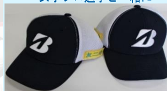
寄贈 ゴルフキャップ