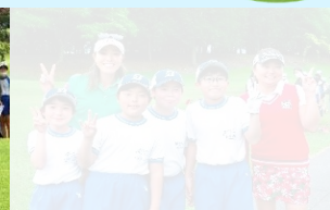
女子プロ選手と一緒に