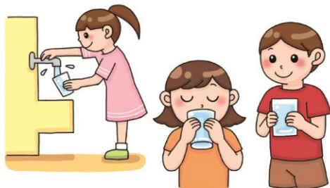
のどが渇く前に水分補給