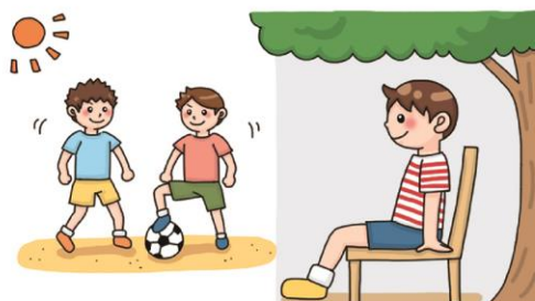
疲れたと感じる前に休憩