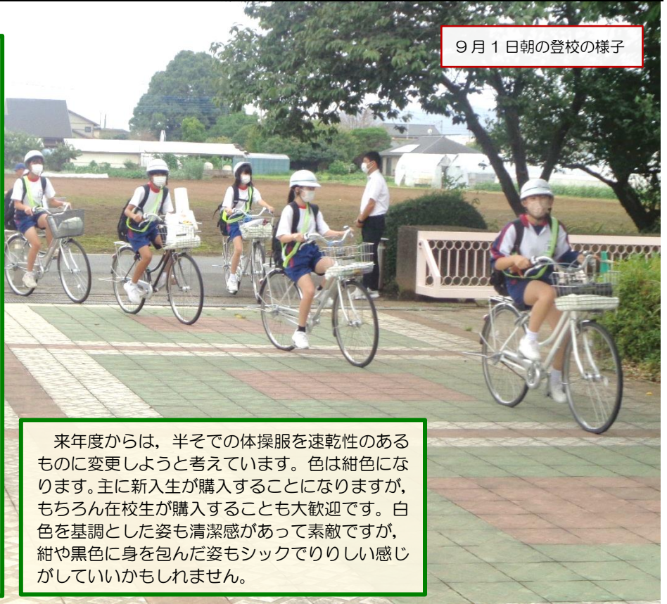
9月1日朝の登校の様子

面白いなと思ったのは、紺色の靴下をはいている生徒を見かけなかったことです。そういえば、生徒総会でも紺色は教師サイドが良かれと思って追加した色でした。生徒会からの要望はきちんと生徒の嗜好を反映したものだったので、改めて、生徒の実態に寄り添った生徒会活動の良さを見直しました。