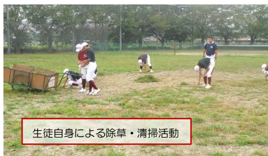
生徒自身による除草・清掃活動