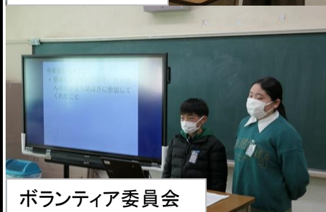
ボランティア委員会