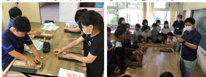
講師の先生の話聞いて、かんな削りに挑戦しました！

総合的な学習の時間の一環で、「リサイクルはがき作り」「マイ箸作り」を行いました。牛乳パックからパルプ液を作って紙漉きをしたり、笠間林業指導所の方々にご指導いただきながら端材から箸を作ったりと、いきいきと活動していました。捨てればゴミになってしまうものでも、使い方を考えるとまた使えるものに生まれ変わるということに気付くことができました。今後もSDGsの意識を高めていけるよう努めていきたいと思えます。