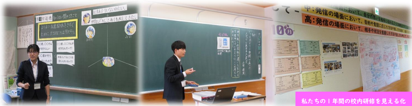
私たちの1年間の校内研修が見える化

私たちは、子どもたちの学力向上を目指して、日々授業改善に取り組んでいます。昨年度から、校内研修テーマ「ICTとこれまでの教育実践のベストミックスによる授業改善～特に、発信力の向上～」を設定し、研修内容が見える化しながら、教職員が一丸となって授業改善に努めてきました。