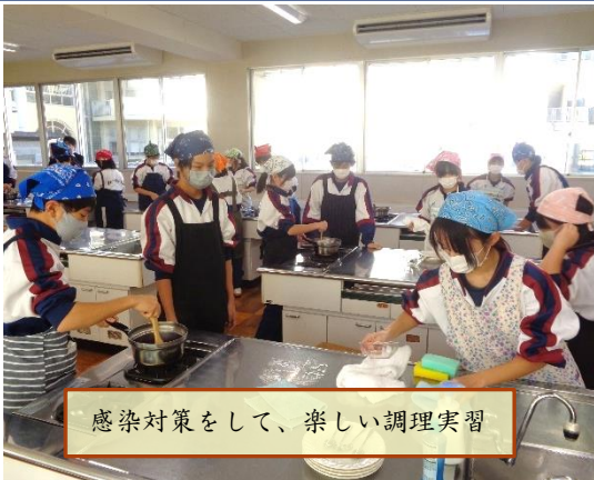
感染対策をして、楽しい調理実習

一方、朝ランのない火・木曜日は、第61回県下中学校交歓笠間市駅伝大会(1/14)に向けて、駅伝練習を行っています。それぞれの設定タイムに従ってタイム走を行っています。先に走り終えた選手から「ファイター」の声が次々とかけられます。陸上競技は個人競技であるけれども団体競技でもあると言われる所以です。一人では乗り越えられない困難もみんなと一緒に超えられる。頑張れ、友二中生！