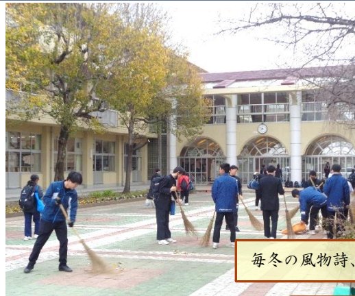
毎冬の風物詩、昇降口前の落ち葉掃き