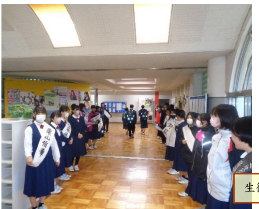
生徒会役員改選に伴う選挙活動