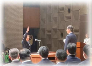
人々に感動を与えた選手宣誓