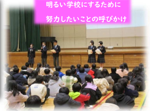
明るい学校にするために 努力したいことの呼びかけ

いじめは、相手の心や体を傷つける行為であることを理解するとともに、いじめをしない、させない、見過ごさない、見て見ぬふりをしないための実践力の基礎を培うことを目的として、全校児童生徒で人権集会を行いました。児童生徒会長から、人権集会の趣旨説明があった後、まず、「人権〇×クイズ」を行いました。「Aさんから悪口を言われたから、Aさんの上履きを、Bさんが隠しました。これはいじめでしょうか。」というクイズでは、かなりの児童生徒が「いじめではない」と答えていましたが、「いじめられても仕返しをしてはいけません。」と説明されると、納得した表情をしていました。次の学校評価アンケートの結果では、「友達と協力して活動するのは楽しいですか。」という設問に、低・中・高学年ブロックとも、ほぼ全員が肯定意見だったことを確認し、喜びました。最後に、児童生徒会役員の皆さんが、明るい学校にするために努力したいことを呼びかけました。