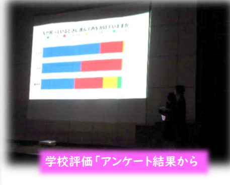
学校評価「アンケート結果から