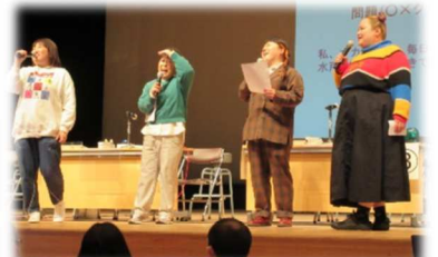
ゲストは森三中とおかずクラブ