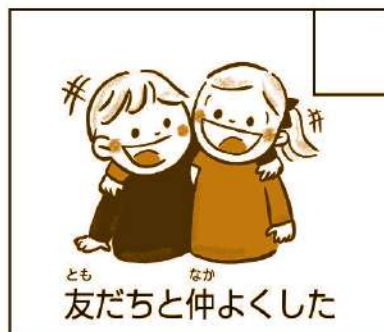
とも なか 友だちと仲よくした