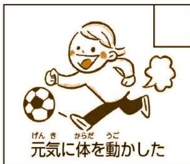
げんき からだ うご 元気に体を動かした