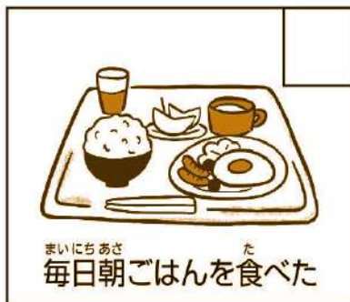
まいにちあさ た 毎日朝ごはんを食べた