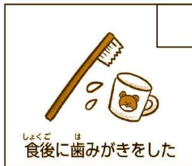
しょくご は 食後に歯みがきをした