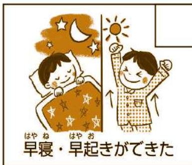
はやね はやお 早寝・早起きができた