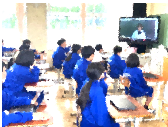
生徒総会で学級訓を発表