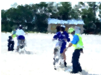
交通安全教室(講話と実技研修)閉会式の様子