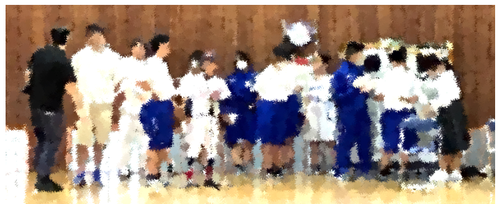
部活動激励会 進行と運営を任された1年生有志