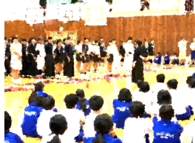
緊張の中で大役を果たし、お互いの頑張りを認め合う実行委員↑