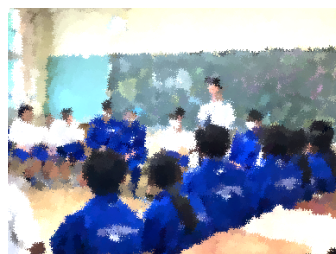
教育実習生とのお別れ会