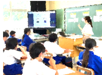
栄養指導(中学生の朝食)