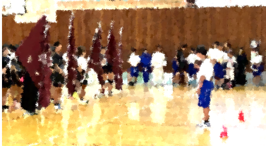
総体に向かう先輩方の力となることができました