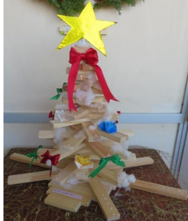
【 クリスマスツリー 】