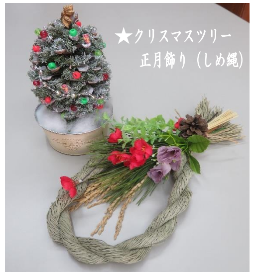
★クリスマスツリー 正月飾り(しめ縄)