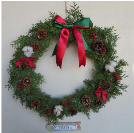
【 クリスマス檜リース 】