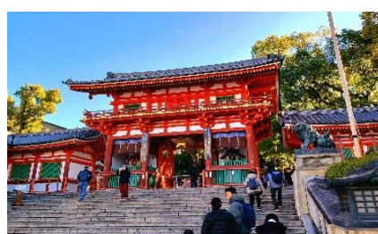
【八坂神社】本殿周辺の紅葉がきれいでした。