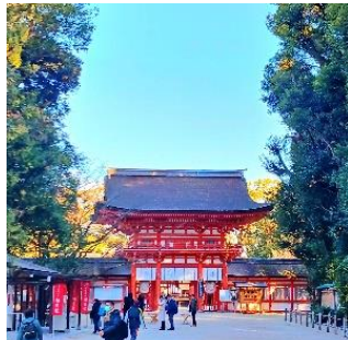
【下鴨神社】簾越しの巫女