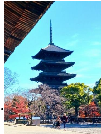
【東寺】紅葉彩る五重塔。国宝（仏像）並ぶ宝物殿。