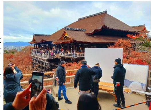
【清水寺「今年の漢字」準備風景】