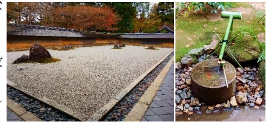
【龍安寺 石庭】 【つくばい】