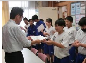
1年 ペットボトル キャップ数え隊

今回は1年生の集団での活躍が推薦されました。これからも善い行いを積み重ね、自分自身を高めていくことを願っています。