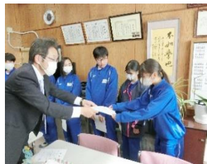
1年 4組 学級活動 地域貢献ボランティア