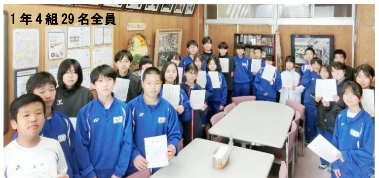
1年 4組 29名全員